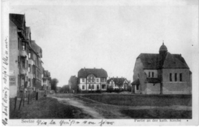
Ende der Südstraße mit kath. Kirche (Ansichtskarte 1915)