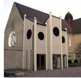
Anbau mit neuem Eingangsbereich (Monika Paul 2002)

Als der Hildesheimer Bischof Adolf Bertram am 28. September 1913 die neue katholische Kirche in Seelze einweihte, war dies nicht nur ein kirchliches Fest, sondern für ganz Seelze und die umliegenden Dörfer ein wichtiges Ereignis. Dies kam u.a. darin zum Ausdruck, dass zahlreiche Vertreter staatlicher und kommunaler Behörden, weltlicher Einrichtungen und örtlicher Betriebe an der Feier teilnahmen.